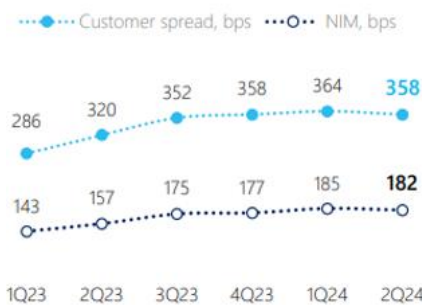
Margins show resilience to (-) index resets

En cuanto a los últimos resultados financieros, Caixabank ha su solidez. En el primer semestre de 2024, la entidad bancaria ha demostrado como ha sido capaz de mantener estable el margen por cliente .