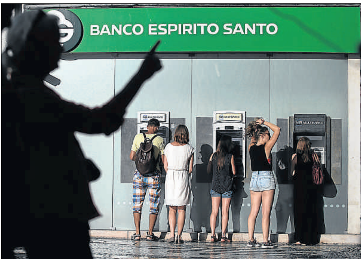
Clientes del Banco Espírito Santo frente a un cajero automático de la entidad, ayer en Lisboa

Aunque el clima macroeconómico que se respira en el país es bueno (en términos de PIB, paro o indicadores de confianza), la sesión acabó cerrando julio con un sabor agri dulce. El Ibx se ha dejado el 2% en el mes.●